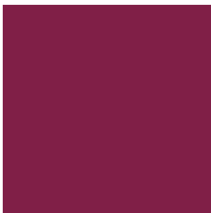
GRANATE Ral 3005 6703