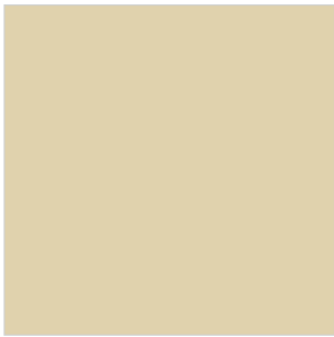
MARFIL Ral 1013 6705