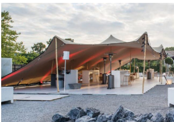
Пример конструкции F5637